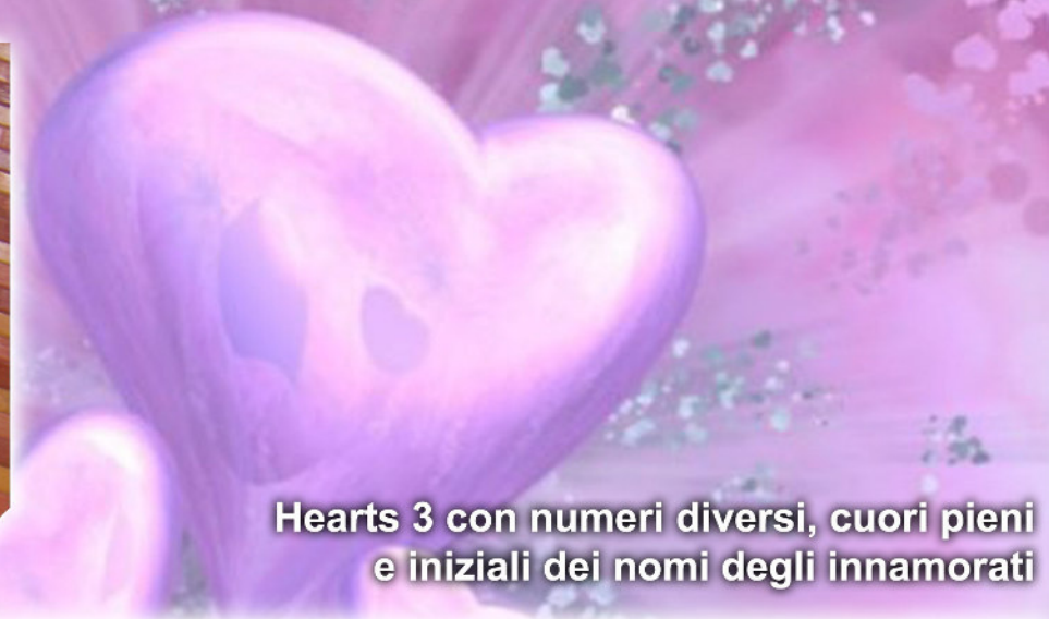
Hearts 3 con numeri diversi, cuori pieni e iniziali dei nomi degli innamorati