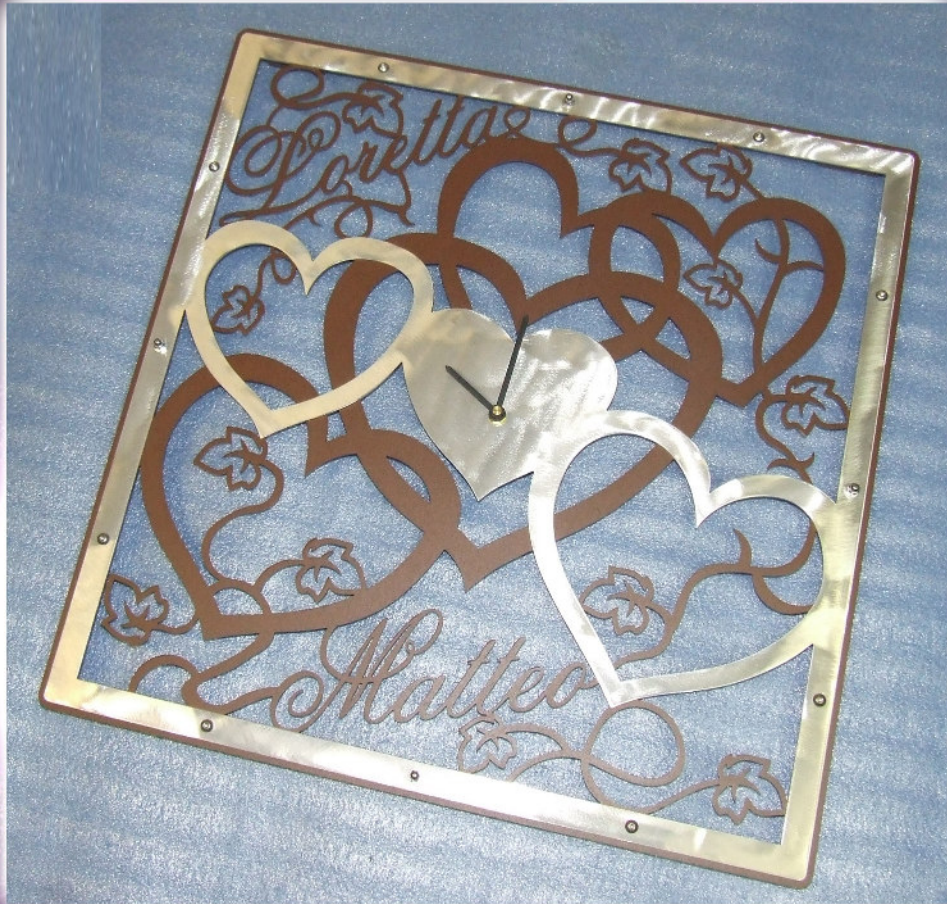
Modelo Heart 2 con inserimento dei nomi Loretta e Matteo